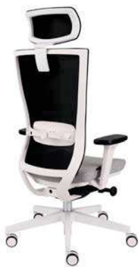
Marti WS HD White