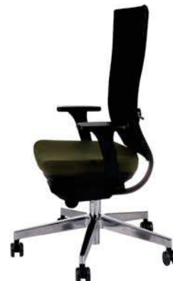
Marti BS Chrom