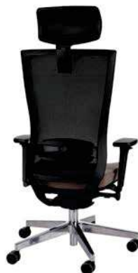
Marti BS HD Chrom