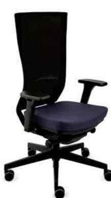
Marti BS Black