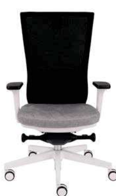
Marti WS White