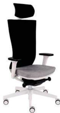
Marti WS HD White