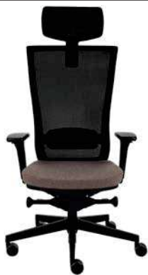
Marti BS HD Black