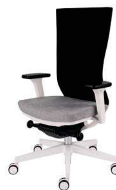
Marti WS White