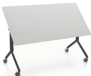
OT 2L Y