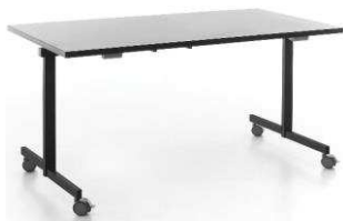
OT 2L T