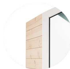
THS [...] W