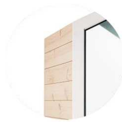
THS [...] W