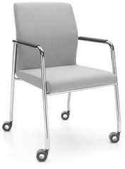
Frame version: 30HC