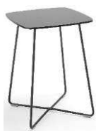
TB 29 SQ 570