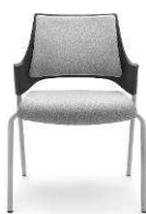
MO 215 3N