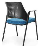
MO 220 2N