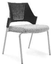
MO 215 2N